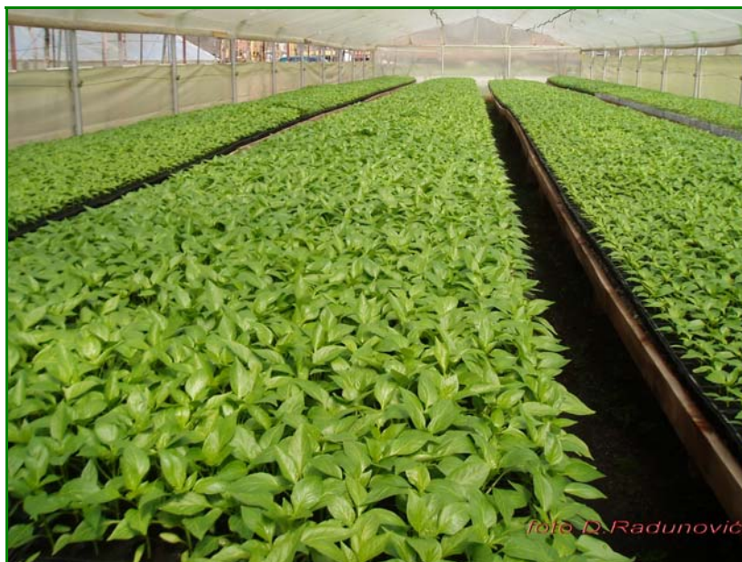
Sl.4. Rasad paprike spreman za sadnju na stalno mjesto

Rasad koji je na ovaj način sačuvan i pripremljen imaće dobro razvijen korjen i stablo i moći će da obezbjedi visok prinos i kvalitet.