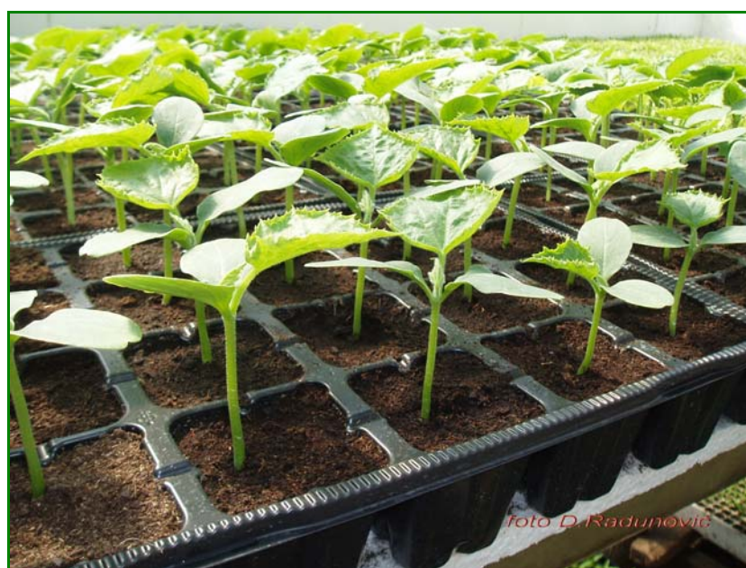
Sl.3. Dobro razvijen rasad krastavca

Treće zalivanje kombinacijom istih sredstava obavlja se prilikom rasađivanja kako bi se koren dobro natopio i zaštitio. Ovako pripremljen rasad lakše će se ukorjeniti i bolje podnijeti stres pri iznošenju na stalno mjesto.