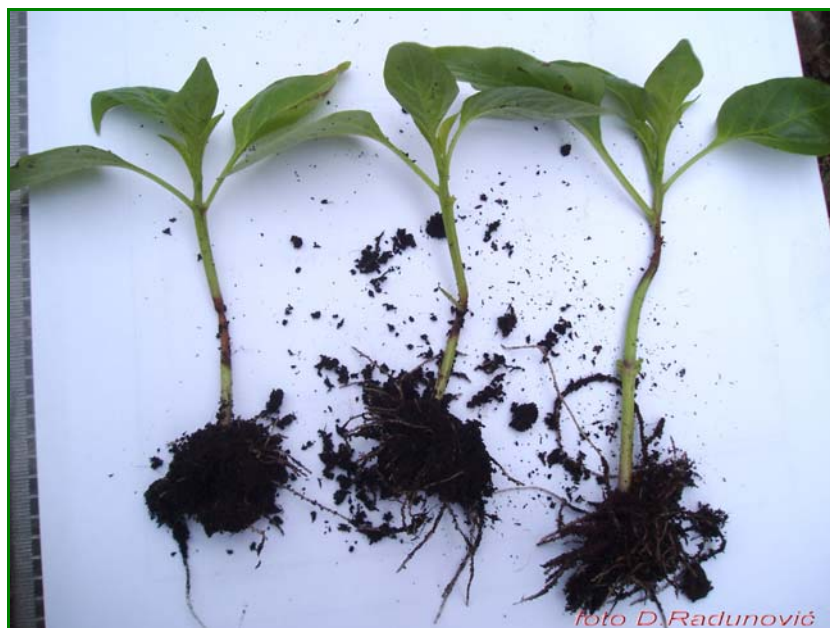
Sl.2. Nekroza na prizemnom djelu stabla

Prvo zalivanje fungicidima treba obaviti odmah poslije sjetve. U tu svrhu mogu se koristiti preparati Previcur 607 SL (u koncentraciji 0,25%) i Previcur Energy (0,15%). Rastvorom ovih sredstava zalivaju se biljke i sâmo zemljište oko biljaka. Na taj način uništavamo gljivice koje mogu izazvati polijeganje i propadanje biljaka.