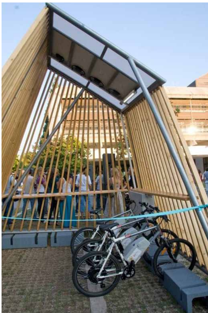
Stanica za električna bicikla na solarno napajanje, Podgorica

Sektor za preduzetništvo i industriju ima za zadatak da u narednom periodu promoviše razvoj „zelene ekonomije“. Ovaj sektor je prepoznao potrebu informisanja o CIP programu u kojem se nalazi i takmičenje za Eko-inovacije. Radi se o programu Zajed-