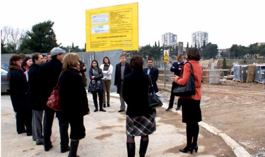
Početak radova na izgradnji ekološke zgrade Ujedinjenih nacija u Podgorici, prvog takvog objekta UN-a u svijetu

Crna Gora razvija saradnju na multilateralnoj i na bilateralnoj osnovi sa brojnim partnerima. Preko svojih diplomatsko-kon-