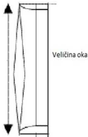
Maksimalno rastegnuto oko mrežnog tega